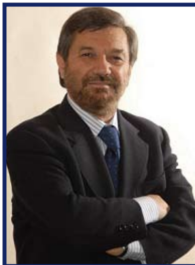
Il delegato alla Protezione Civile Serafino Di Palma

che grazie al nostro impegno e a quello dei volontari teniamo sotto controllo, garantendo così la sicurezza del cittadino e la salvaguardia di un patrimonio boschivo così altamente valido sotto il profilo naturalistico. Il nostro territorio è ampio e quindi la collaborazione di volontari e associazioni altamente qualificate capaci di far fronte a questo disagio è stata senza dubbio proficua».