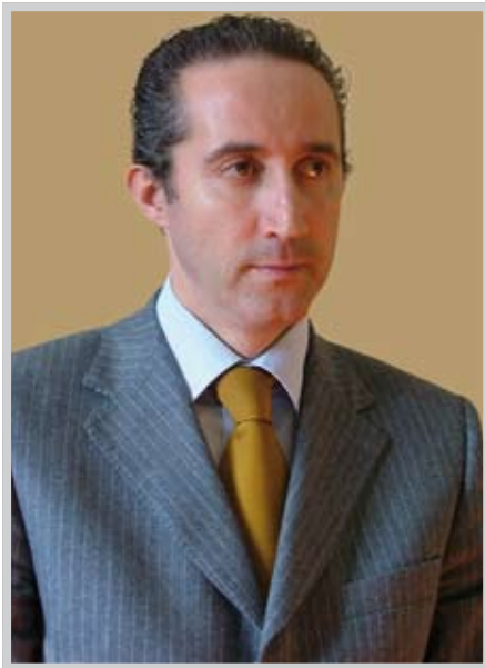
Il Presidente della Provincia di Latina Armando Cusani e il Governatore del Lazio Piero Marrazzo

Co 2 ed efficienza energetica, saranno "quasi invincibili" (l'accordo del 20-20-20 è stato siglato per facilitare una posizione globale post-Kyoto alla Conferenza di Bali lo scorso dicembre e punta, per l'Unione Europea, sulla riduzione del 20% le emissioni da gas serra sul continente, sulla riduzione del 20% dell'intensità energetica ai livelli attuali determinata dal rapporto tra consumo di energia e prodotto interno lordo, sull'aumento del 20% della quota di fonti rinnovabili rispetto al totale delle fonti primarie utilizzate dalla Unione Europea). L'Enea conferma cosa avevamo già ipotizzato: le energie rinnovabili, oltre a