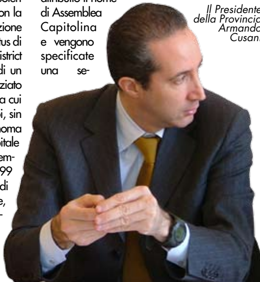
Il Presidente della Provincia Armando Cusani

dell'enunciazioni di principio, quanto postulato nel terzo comma dell'art.114 non aveva trovato riscontro sino all'emendamento al Disegno di legge sul federalismo fiscale approvato il 3 ottobre 2008 dal Consiglio dei Ministri. In realtà, quanto previsto nel citato emendamento non rappresenta certo l'attuazione completa del dettato costituzionale, limitandosi a trasformare il comune di Roma in un ente territoriale denominato Roma Capitale con speciale autonomia statutaria, amministrativa e finanziaria. Inoltre, al Consiglio comunale viene attribuito il nome di Assemblea Capitolina e vengono specificate una se-