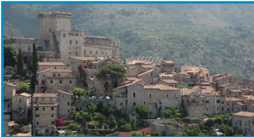
Vista di Sermoneta

«Il turismo - ha concluso Cusani - sta dando alla nostra provincia un contributo, anestetizzando la crisi che purtroppo in altri settori esiste. Se è migliorata la qualità del turismo provinciale è grazie anche al lavoro serio che abbiamo fatto per l'ambiente. A partire dalle acque pulite e balenabili che senza depuratori non sarebbe stato possibile ottenere».