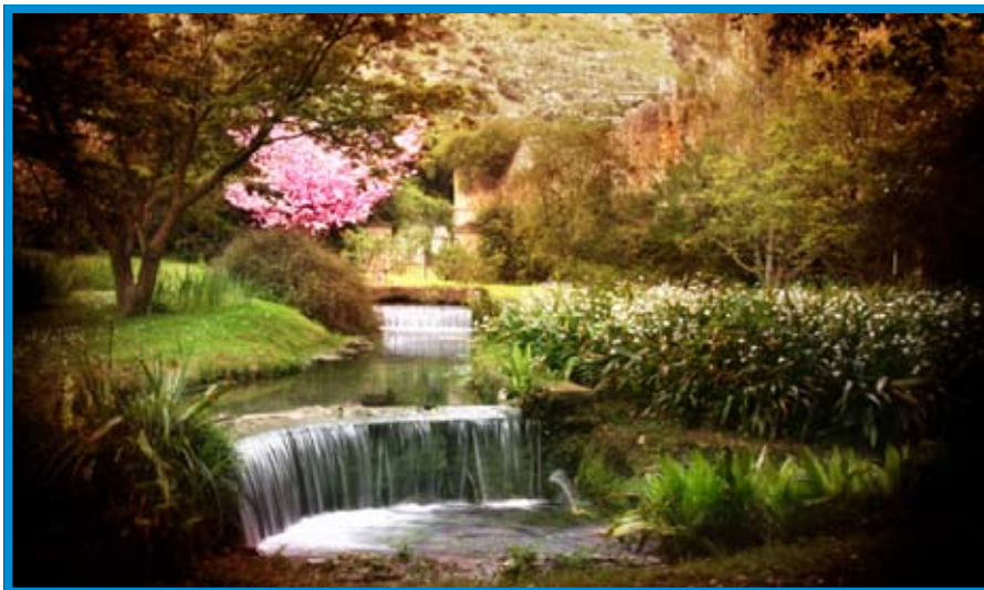
L'oasi di Ninfa - Cisterna

: -11,08; altre strutture ricettive (ostelli, bed & breakfast e case per ferie): +3,12. Analizzando invece i dati delle provenienze straniere, limitatamente alle prime 6 nazionalità in base ai risultati del 2007 realizzati negli alberghi, si hanno le seguenti risultanze: Germania: +10,6%; Russia: +30,5%; USA: -22,8%; Regno Unito: -8,77%; Svezia: +6,43 per cento.