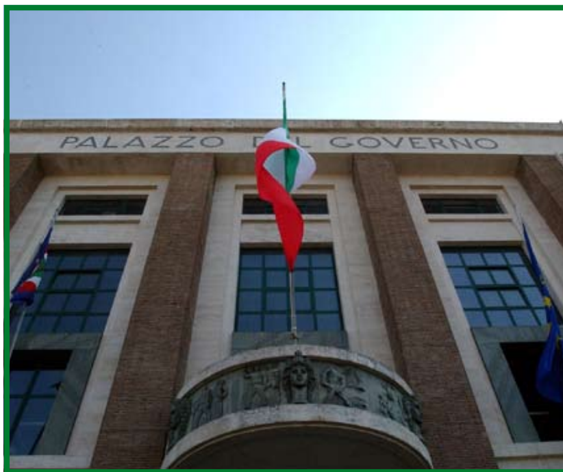
La sede della Provincia di Latina in via Costa

energetico sostenibile, dedicarsi alla salvaguardia e alla protezione dell'ambiente dai fenomeni dell'inquinamento e in particolare quello atmosferico. Proprio la promozione delle fonti rinnovabili è, al giorno d'oggi, una priorità morale non solo nazionale ed europea ma a cui deve essere rivolto tutto l'interesse planetario. L'Italia sta vivendo un periodo molto delicato. La finanza, l'industria, la nostra vita quotidiana è sempre più influenzata dal mercato del greggio. L'andamento instabile del prezzo del petrolio a cui stiamo assistendo in questo periodo incide soprattutto sui prezzi della nostra quotidianità. In particolare, nella nostra provincia abbiamo toccato con mano il problema del caro gasolio che ha messo in difficoltà quest'estate il merca-