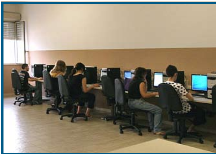
Aula di informatica dell'Agenzia Formazione Lavoro

in tema d'obbligo formativo, dove in poco più di due anni si è riusciti a raddoppiare il numero degli allievi frequentanti i corsi, assicurando così a tutti i giovani del territorio la possibilità di esprimere un proprio diritto all'interno di una struttura che fa dell'efficienza e dell'affidabilità la sua caratteristica fondamentale. E' ragionevole affermare, per concludere, che il convegno "La formazione come servizio al territorio", ha offerto l'opportunità per cogliere la grande dinamicità della Provincia sul tema della formazione, della sua capacità di essere vicino ai bisogni reali offrendo soluzioni e dispositivi efficaci, capaci di incidere positivamente sui fenomeni occupazionali del territorio.