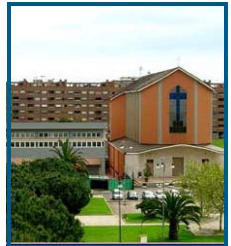
La Curia vescovile di Latina

Con l'inaugurazione della nuova Curia si è raggiunto un obiettivo rilevante al quale hanno partecipato, contribuendo, anche tanti cittadini (esempio concreto di autodeterminazione del popolo pontino) rispetto a uno Stato centrale poco attento e non presente concretamente nei fatti, oltre ad una Regione Lazio latitante e sorda ad ogni vero interesse della Provincia