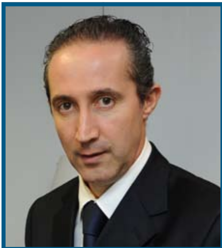
Il Presidente Armando Cusani

Posso assicurare che ieri all'inaugurazione della nuova Curia c'eravamo con il cuore e con la mente e ci saremo anche in futuro, nel tentativo di contribuire a rinforzare tutti quei percorsi che incontrano le varieghe forme della solidarietà verso coloro che più ne hanno bisogno. Solidarietà e sussidiarietà sono del resto stati due pilastri fondamentali della nostra azione di governo, contro l'indifferenza, la passività, l'isolamento, l'egoismo, ma anche come partecipazione democratica rispetto ai diritti e doveri di ciascuno».