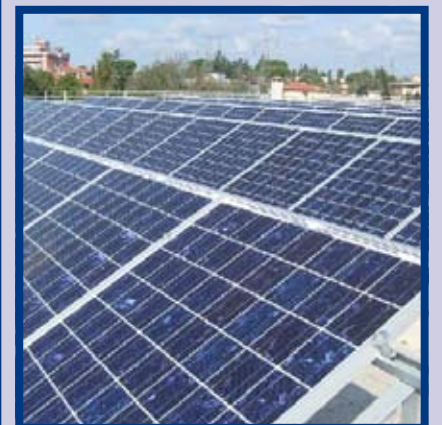
L'inaugurazione dell'impianto fotovoltaico del San Benedetto di Latina