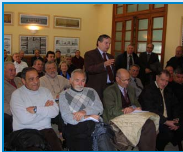
Due momenti della conferenza stampa di presentazione del progetto "Il teatro non invecchia"