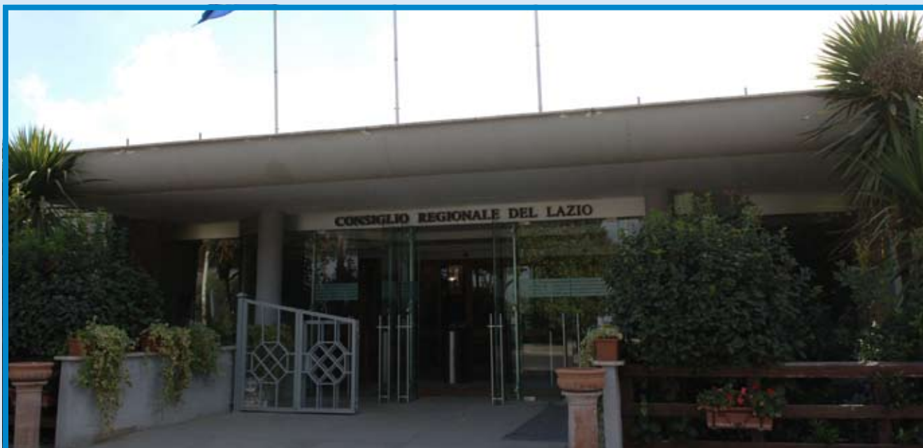
La sede del Consiglio regionale del Lazio

Nel bilancio regionale 2008 tagli scriteriati alle Apt, tranne quella di Roma