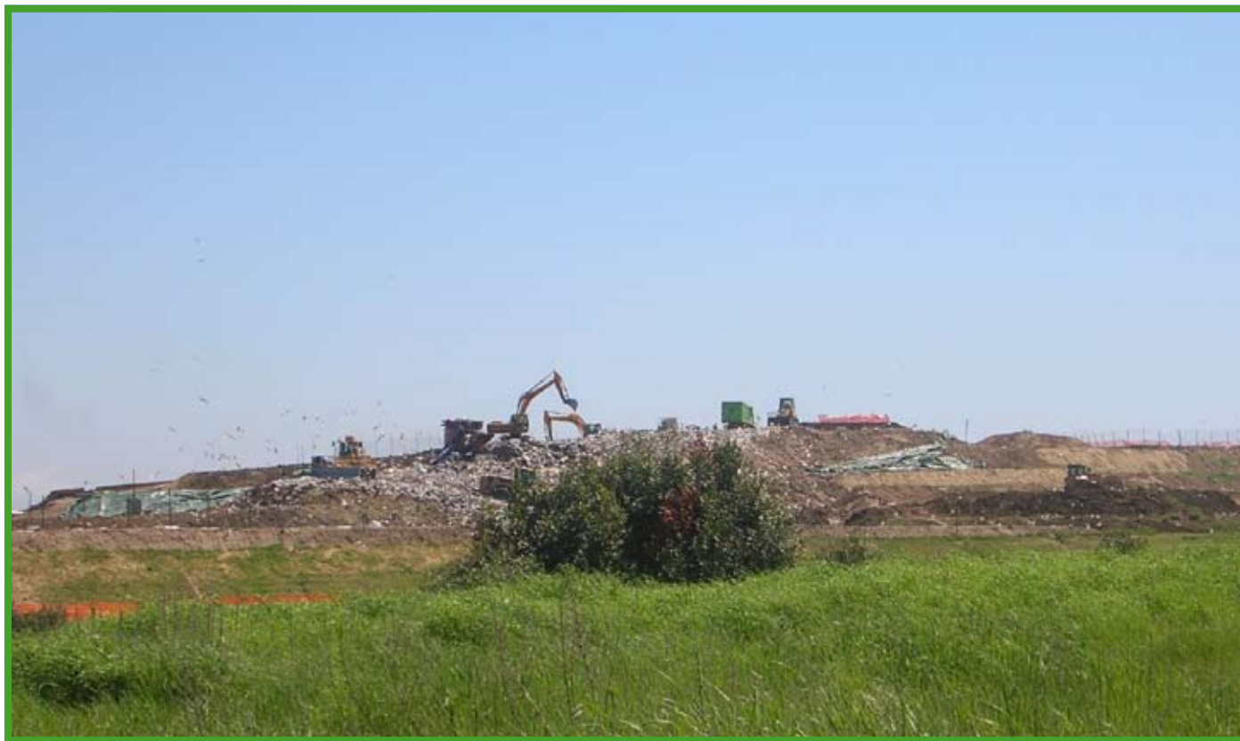
La discarica di Borgo Montello