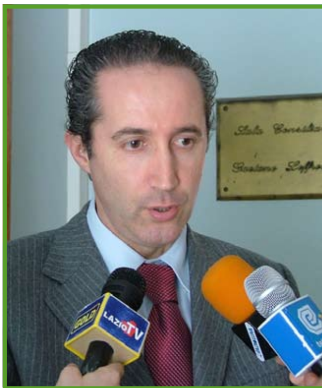
Il Presidente della Provincia di Latina Armando Cusani

Sul tema dei rifiuti la provincia di Latina non ha mai alzato barricate ideologiche o politiche di mera e strumentale contrapposizione, ma ha sempre posto alcuni punti fermi di discussione concertata