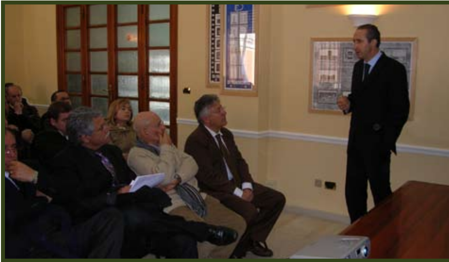
Un momento della riunione tenutasi nella Sala Loffredo della Provincia di Latina

Le immagini proiettate hanno evidenziato la forza distruttrice del mare