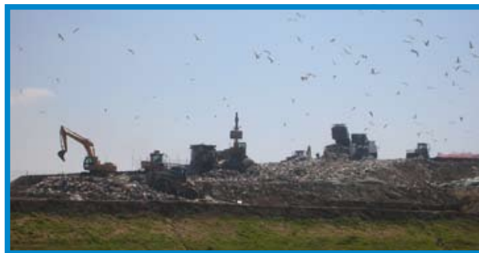
La discarica di Borgo Montello

Il presidente Piero Marrazzo e i suoi burocrati sanno bene che il ricorso prodotto al Tar è illegittimo, basta leggere la proposta di legge sugli Ato passata in giunta il 23 gennaio scorso: non esiste nessun piano commissariale dei rifiuti, ma solo degli atti commissariali che hanno autorizzato alcuni impianti.