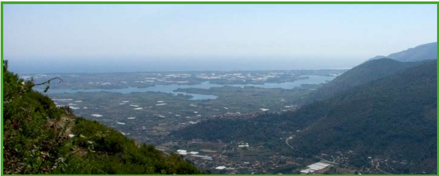
Il lago di Fondi

Strategia per frenare l'assalto al territorio da parte dei Marrazzo e company