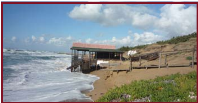
Litorale di Sabaudia