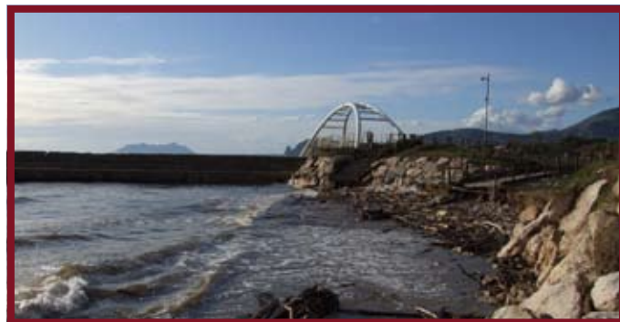
Litorale di Fondi