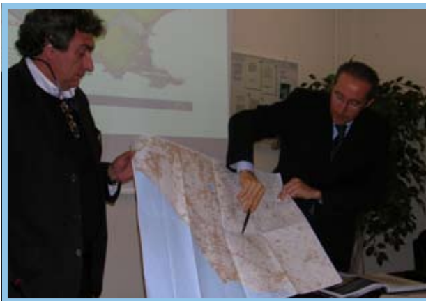
Presentazione del nuovo tracciato della via Flacca

Il programma finanziario stilato dai tecnici della provincia di Latina prevede un costo complessivo di circa 30 milioni d'euro, di cui 20 per la sola parte che collega la galleria Scarpone alla provinciale S. Agostino.