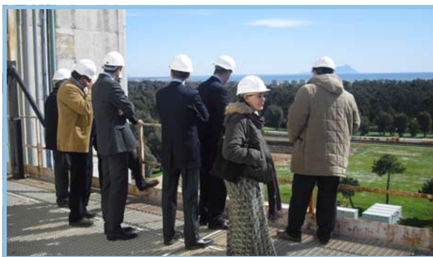
Ex-centrale nucleare di Borgo Sabotino