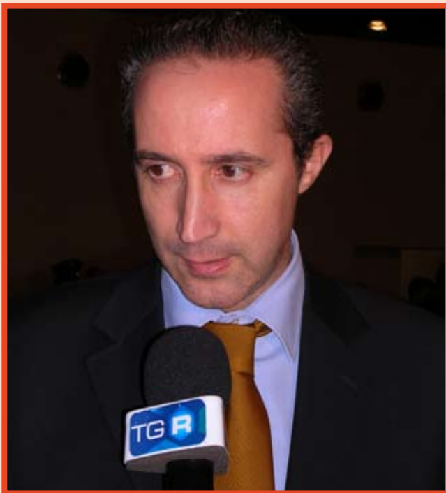
Il Presidente della Provincia di Latina Armando Cusani

Il compito delle amministrazioni locali è quello di investire sulla scuola, di scommettere sulla formazione, cercando nel territorio le opportunità. La Provincia di Latina ha puntato da subito sull'innalzamento degli standard qualitativi dell'offerta formativa del territorio.