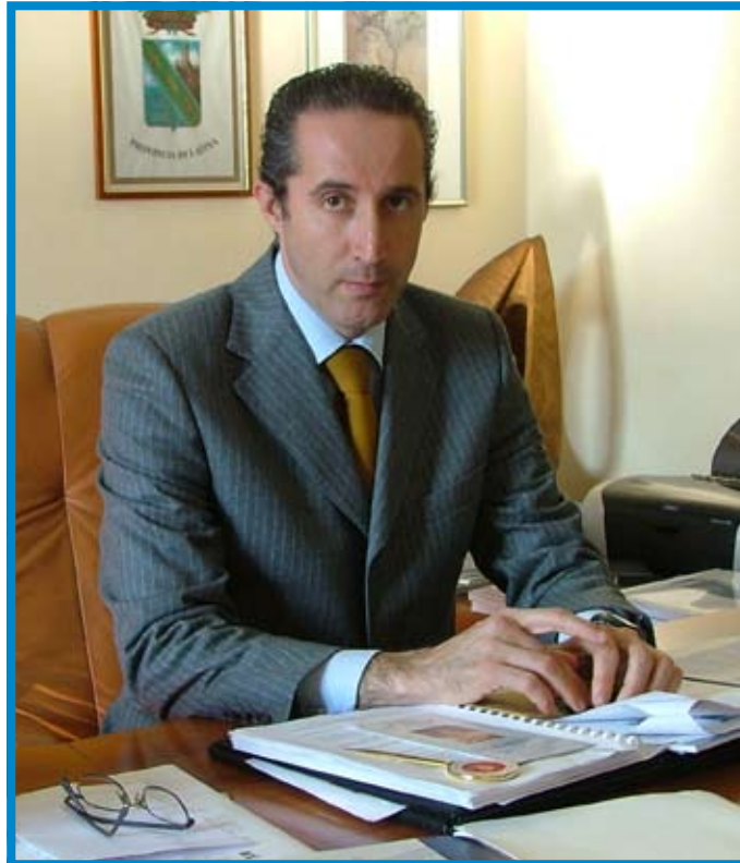
Il Presidente della Provincia Armando Cusani

Nel corso dell'incontro i tecnici della Sogin hanno mostrato agli ospiti le attività finora realizzate e illustrato il piano industriale, che prevede una significativa accelerazione delle attività di decommissioning, con l'obiettivo di