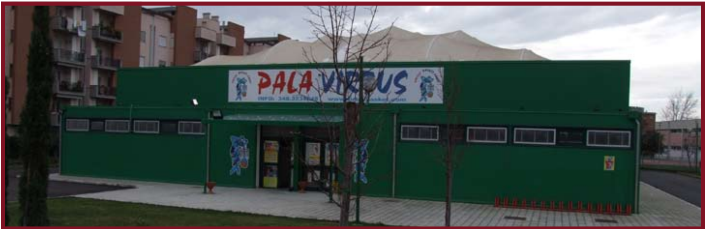
Impianto sportivo polivalente inaugurato nel 2007 a Fondi (zona 167)

Sabato 21 marzo 2009 inaugurazione della tensostruttura di San Donato