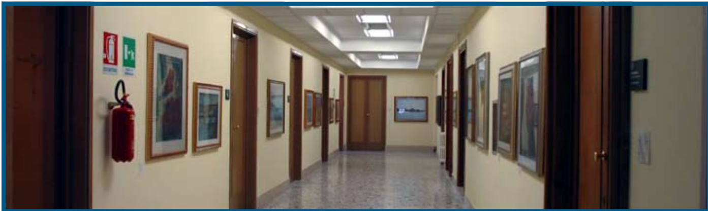
Gli interni della Provincia di Latina in via Costa, 1

La Regione Lazio deve alla Provincia di Latina 21.587.000 euro