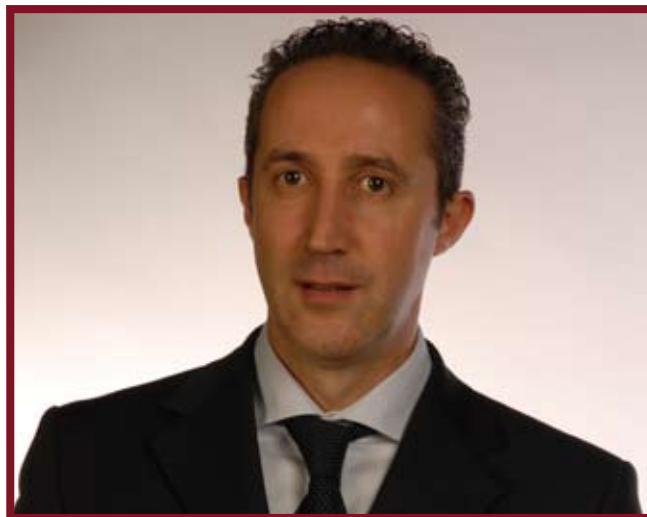
Il Presidente della Provincia Armando Cusani

Il 2004 invece è stato istituito come “l’anno europeo per l’educazione attraverso lo sport”. La pratica delle diverse discipline sportive ricopre l’importante ruolo nel forgiare le identità, nell’avvicinare le persone, nell’acquisire comportamenti di fair play, utili non solo sul campo di gioco ma anche nella vita di tutti i giorni a contatto con situazioni culturali diverse dalla nostra. Ma lo sport riesce a veicolare anche la tolleranza e la solidarietà. E quando qualsiasi proclama o ideologia provoca una distanza sociale incolmabile tra gruppi è invece lo sport che riesce di nuovo a colmare distanze e ad aggregare diverse tipologie d’individuo. Ecco cosa sogniamo. Ecco cosa stiamo promuovendo per i nostri Comuni: l’occasione di creare dei centri capaci