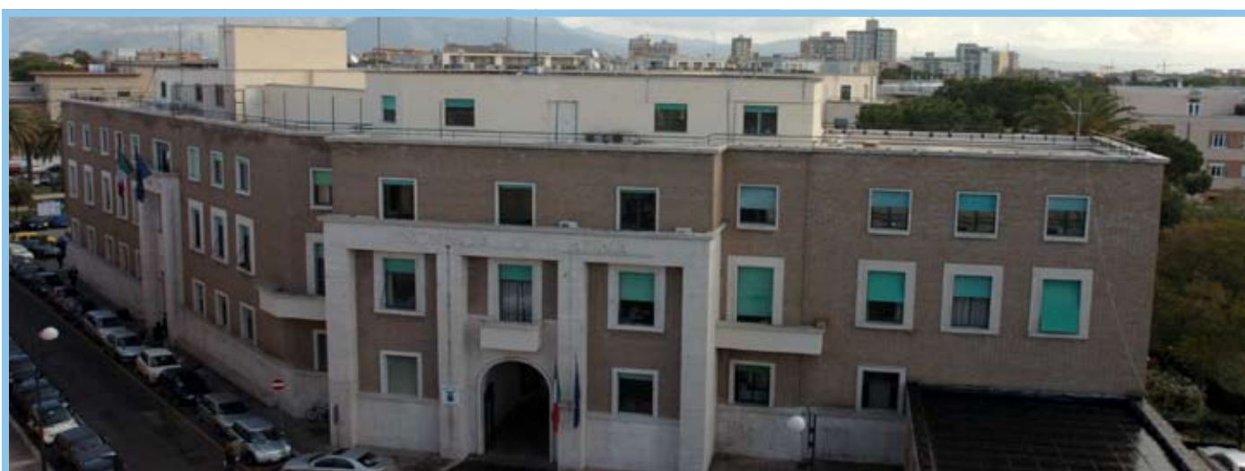
La sede della Provincia di Latina in via Costa, 1

La Regione Lazio deve alla Provincia di Latina 21.587.000 euro