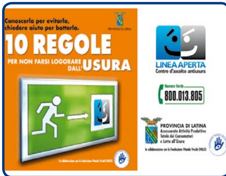
Un momento di un consiglio provinciale e un volantino antiusura diffuso dalla Provincia di Latina