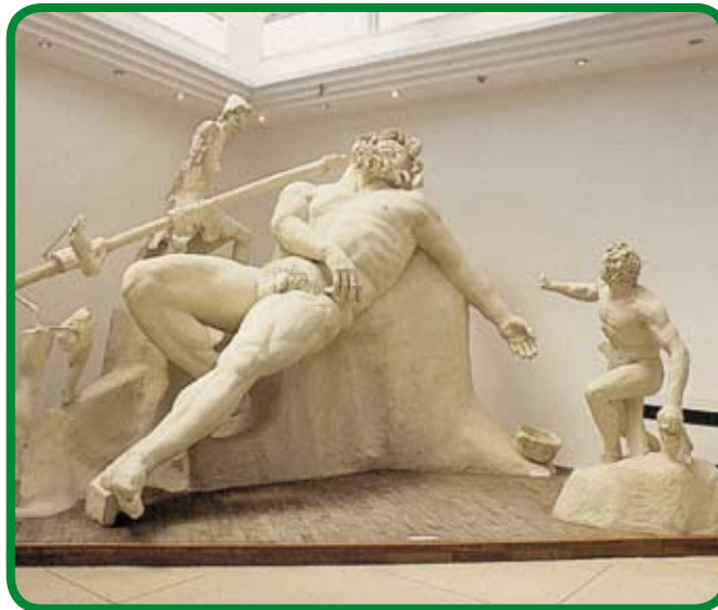
Turismo: il museo archeologico di Sperlonga

U come "Università". La provincia ha tra le sue finalità la diffusione della cultura e la valorizzazione dell'offerta formativa - didattica degli studenti e dei cittadini residenti nel suo territorio, a tal fine intende implementare l'offerta formativa attualmente esistente, sia per il valore