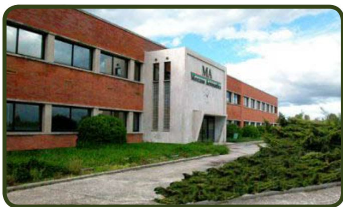
Lo stabilimento della Meccano di Cisterna

D'Arco: «Aspettiamo segnali positivi e concreti dalla Regione Lazio»