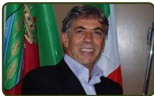
L'assessore provinciale allo Sviluppo Economico Silvio D'Arco

Nei giorni scorsi si è riunito l'atteso Tavolo di Concertazione, convocato dall'Assessore allo Sviluppo Economico Silvio D'Arco, per affrontare le problematiche connesse alla reindustrializzazione dell'ex sito della multinazionale Goodyear di Cisterna di Latina, rilevato com'è noto dalla società Meccano Aeronautica, una vicenda che si trascina da circa un decennio.