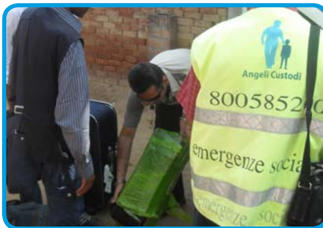
Un'operazione degli Angeli Custodi

più vulnerabili, i più deboli, gli indifesi. Grazie a voi tutti, ancora una volta, potremo perseguire il nostro obiettivo: portare aiuto ai più bisognosi e il dormitorio temporaneo per i senzatetto gestito dalla Croce Rossa a Latina ne è un semplice esempio. Se pur è vero che per il Comitato provinciale di Latina questa è la prima esperienza in questo settore, è anche vero che le Unità di strada pontine entrano a far parte di un network della CRI cui attingere un'esperienza specifica consolidata in decenni di attività, come quella del Comitato della Croce Rossa di Milano che ha affiancato Latina nell'elaborazione delle procedure operative. Inoltre la nuova gestione trova il suo pilastro nella professionalità degli operatori, che già svolgevano questo servizio, e negli Uffici della Provincia, a cui ora si aggiungeranno anche i volontari CRI. Croce Rossa non è solo l'emergenza sanitaria, ma anche l'impegno quotidiano nei Servizi socio-assistenziali, di cui le Unità di Strada sono un esempio».