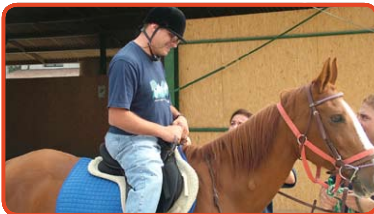
Progetti per lo sviluppo sensoriale dei disabili (Ippoterapia)