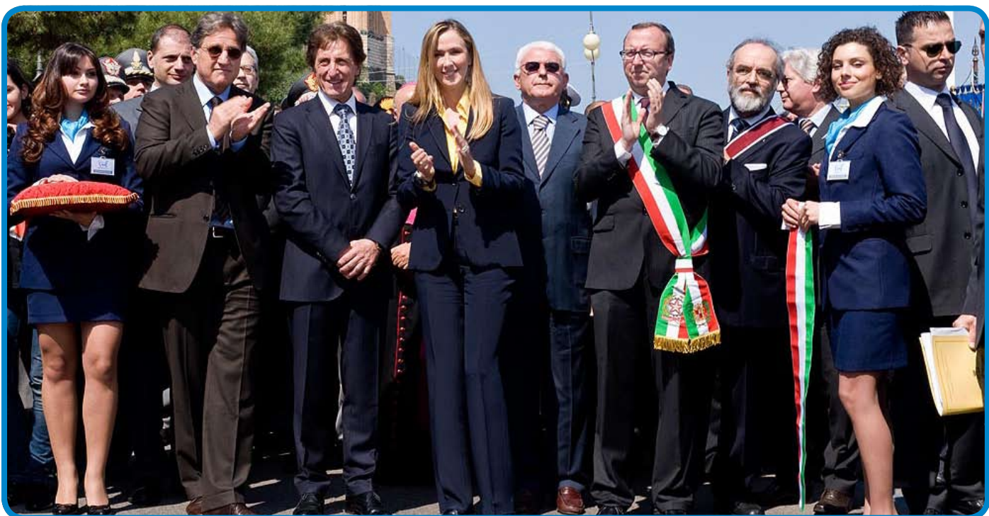
Yacht Med Festival