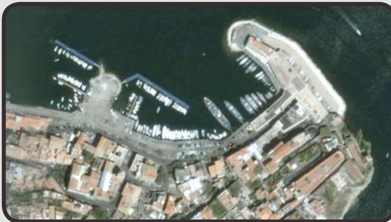
Vista satellitare del Porto di Gaeta

bile federalismo portuale il quale, ancora oggi, risulta essere l'unica scelta vincente e competitiva per garantire l'efficienza e competitività alla portualità laziale.