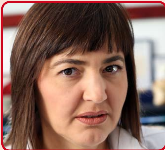
La Governatrice del Lazio Renata Polverini

La stampa nazionale ieri mattina riportava un intervento di Vincenzo Piso, uno dei tre coordinatori del Pdl della regione Lazio, il quale offriva ai lettori una suggestiva analisi politica di quanto successo nei giorni scorsi al Comune di Latina.