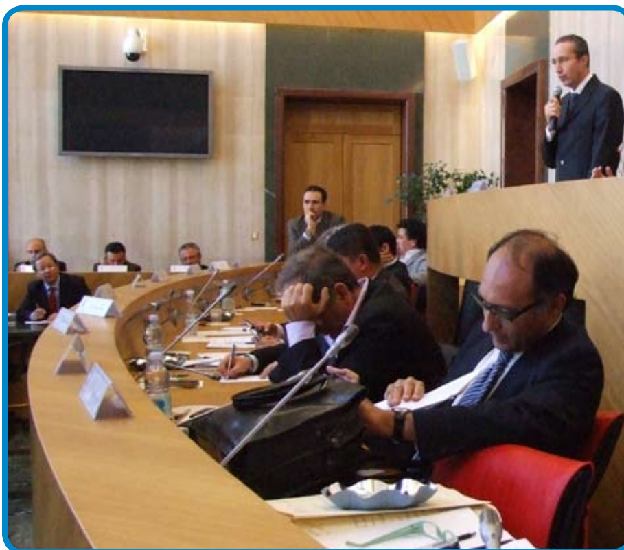
Una immagine del Consiglio provinciale

4. Alla Presidenza della Regione Lazio di attivare una iniziativa autonoma a sostegno dei lavoratori e del territorio Pontino".