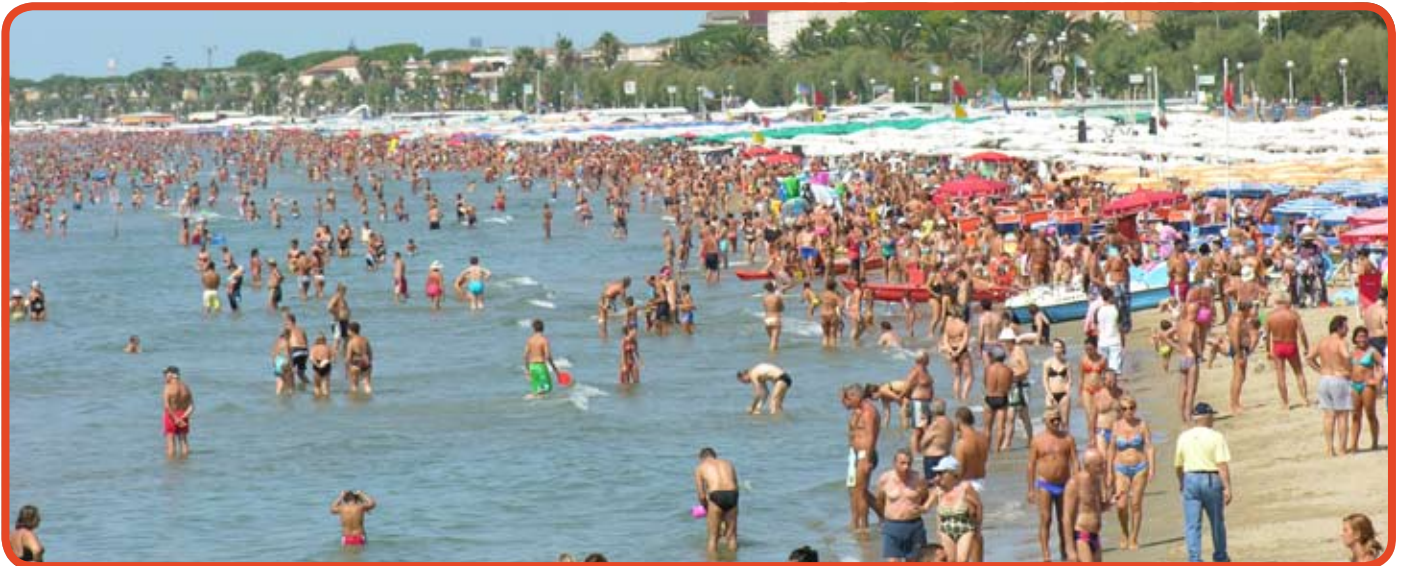
La spiaggia di Terracina affollata di bagnanti

270mila persone all'assalto del mare pontino