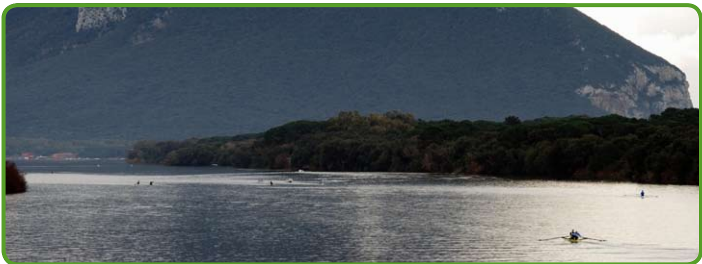
Parziale del Lago di Paola a Sabaudia

La Provincia chiederà il commissariamento del Parco Nazionale del Circeo