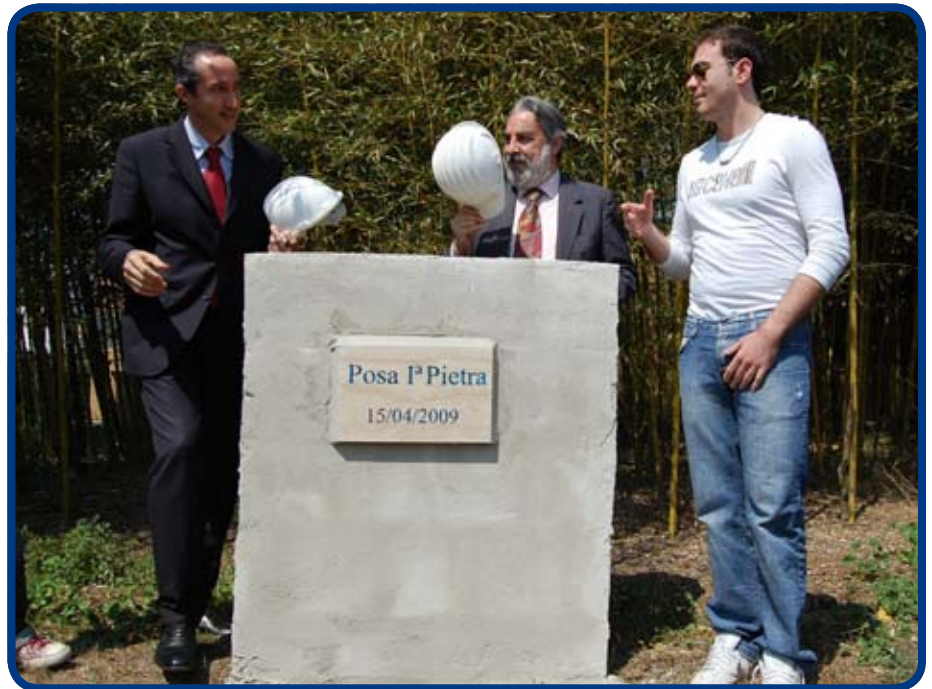
Posa della prima pietra, lavori di ampliamento del Liceo "Leonardo Da Vinci" di Terracina