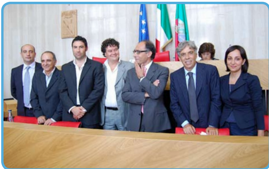
Alcuni membri della giunta provinciale