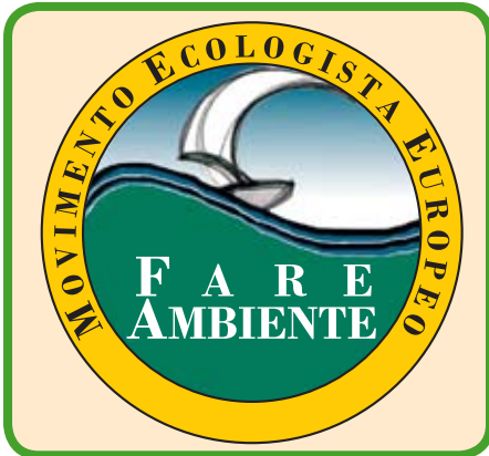
Logo del Movimento Ecologista Europeo Fare Ambiente

Interviene il Movimento Ecologista Europeo Fare Ambiente