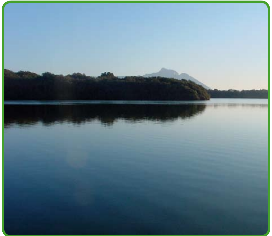
Parziale del lago di Paola (Sabaudia)

Credo poi che qualsiasi problema, può essere risolto solo con l'apporto di tutti.»