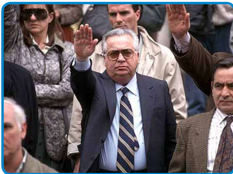
Il Senatore Giuseppe Ciarrapico

Vale la pena ricordare come il comportamento dell'on. Conte e del sen. Ciarrapico sia partico-