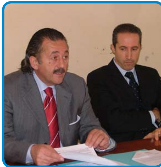
De Monaco e Cusani