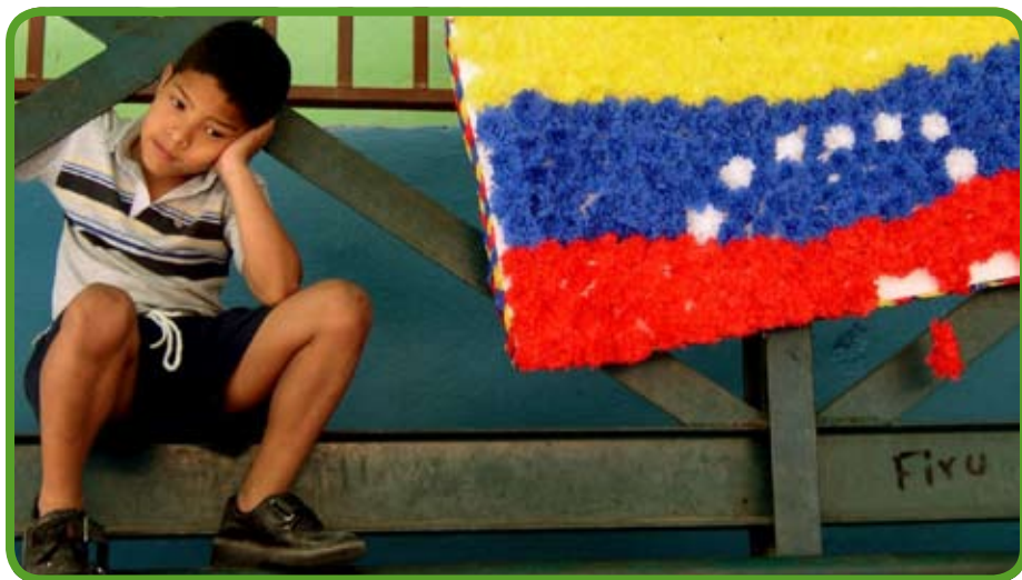
Giovane studente venezuelano

La Provincia accoglierà un giovane italiano residente in Venezuela o un venezuelano discendente di emigrati pontini, che potrà partecipare ad una visita studio di venti giorni. Il bando è rivolto ai giovani nati dopo il 31 dicembre 1982. Alla domanda i candidati dovranno allegare un piano di visita. Un progetto di stage e di incontri, che parta dalle competenze, dal titolo di studio, dalle esperienze professionali. La domanda va inviata via mail entro il 31 luglio prossimo venturo. Il bando ed il modello, in lingua italiana e castigliana, possono essere scaricati dalla sezione avvisi e bandi del sito www.provincia.latina.it